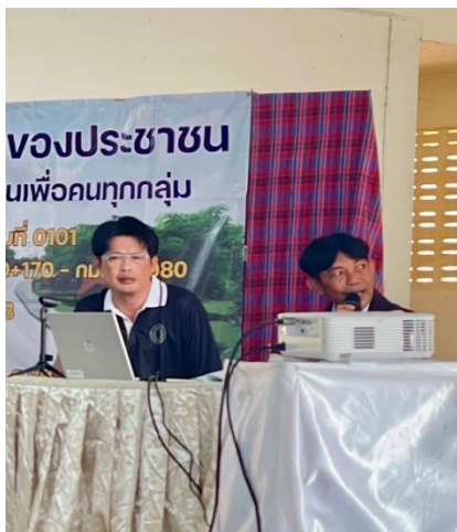
ผอ.ขท.หนองคาย รอ.ขท.หนองคาย หัวหน้าหมวด ช่างควบคุมงาน ช่างคุมงานบริษัทผู้รับจ้างฯ นำเสนอรูปแบบ และตอบข้อซักถาม